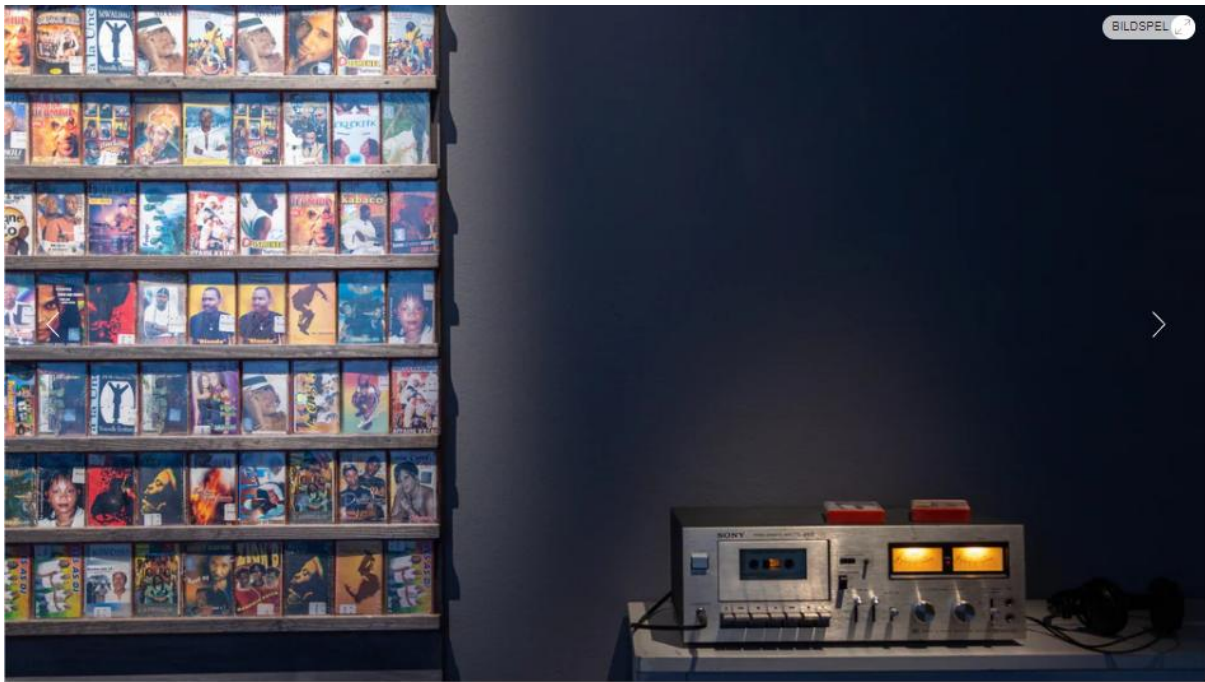
Bild 4 av 5 Del av installationen med kassetband av Theresa Traore Dahlberg