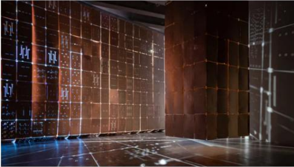
Del av installationen "Coppers" av Theresa Traore Dahlberg

världskapital ismens kreativa förstörelse: hur den i sin jakt på ekonomiska marginaler bygger upp och raserar, förädlar och spottar ut. Flyttar,