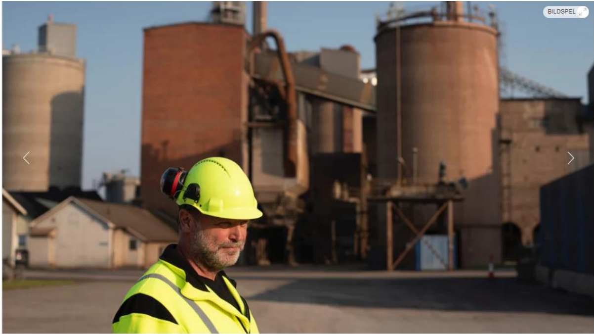
Bild 2 av 5 Stillbild ur "Microcement", från Cementa i Degerhamn på Öland