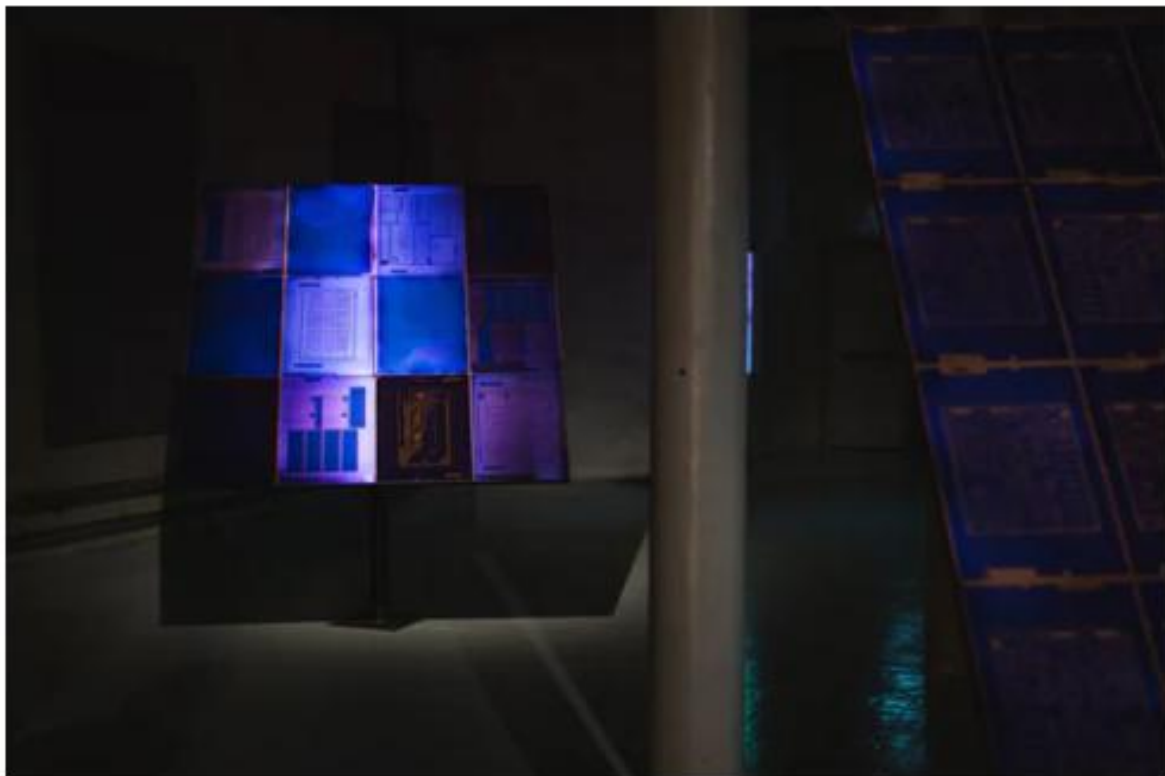
"Untitled Blue" av Theresa Traore Dahlberg.

I Färgfabrikens sakralt belysta sal blir jag först bara sittandes. Andaktsfullt. Vad är det här? tänker jag på pallen. Jag känner bara vagt igen de hundratals guld- och grönskimrande koppararken som i långa remsor täcker väggen och golvet. Glänsande gula ringar fogar ihop kopparbladens alla hörn. Likt örhängen eller förlovningsringar. En konstikonostas? En skulptural filmremsa?