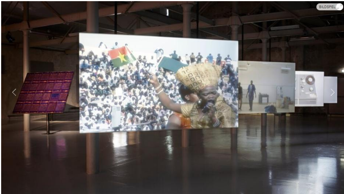
Bild 2 av 2 Vy från Theresa Traore Dahlbergs utställning på Färgfabriken