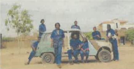
Filmen "Ouaga Girls" tävlade om utmärkelsen bästa nordiska dokumentär vid filmfestivalen i Göteborg 2017.

Aktuell med: Utställning på Kalmar konstmuseum, som skulle ha haft vernissage i mitten av december, men på grund av pandemin skjutits upp till preliminärt februari.