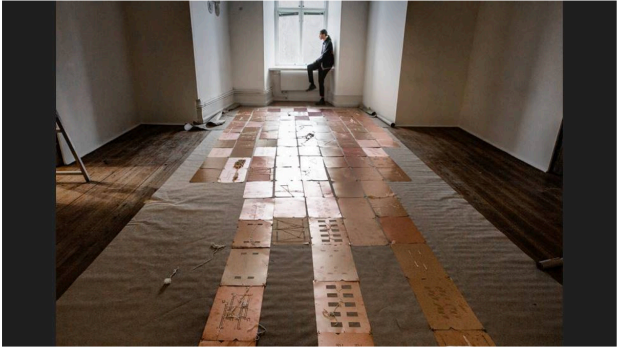
BILD: Sven-Olof Ahlgren | Theresa Traoré Dahlbergs stora verk av hållkort ska hänga i taket på Uppsala konstmuseum.

Hon kommer från Sydkorea och är inspirerad av ljuden som munkarna skapar med metallkärl under bönen i templen.